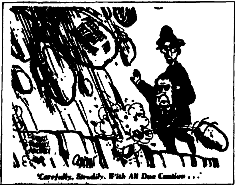
Carefully, steadily. With All Due Caution...