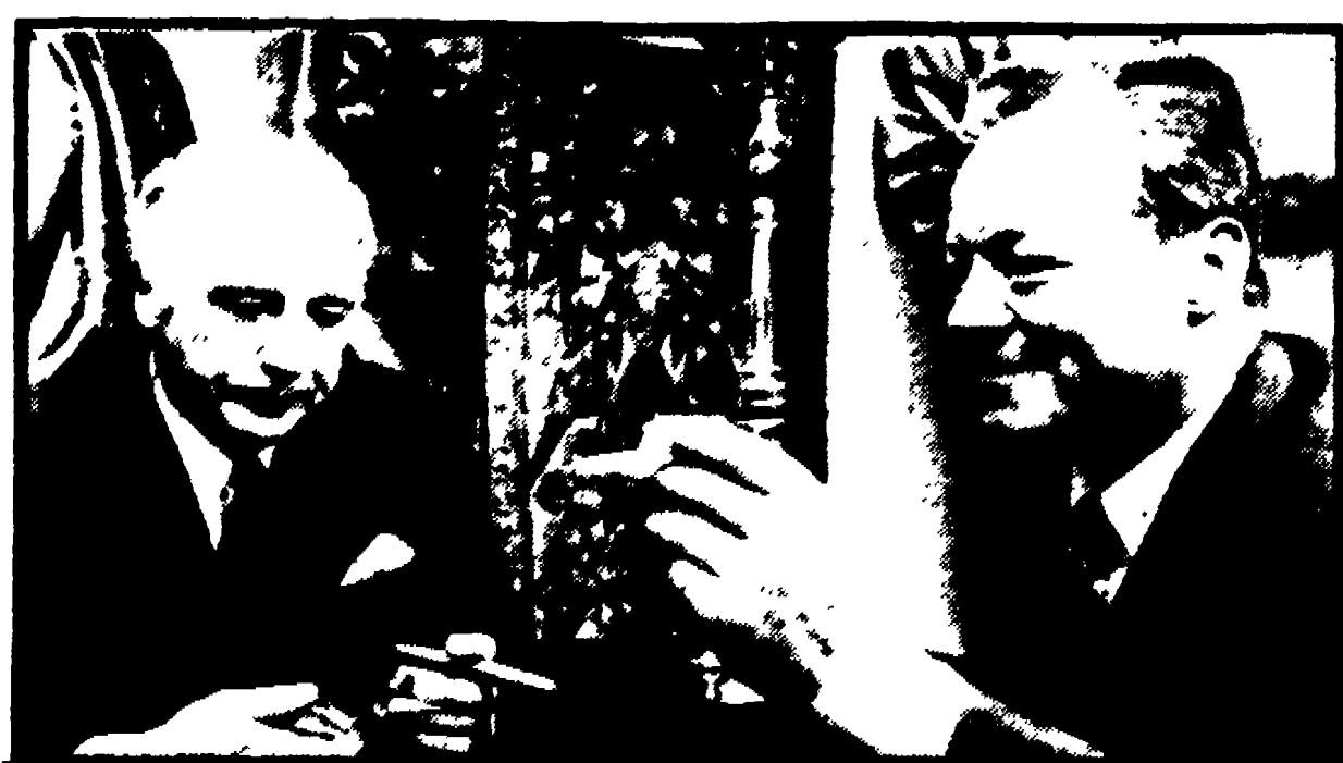
Willy Brandt e Walter Scheel a colloquio dopo il successo delle trattative per la piccola coalizione.