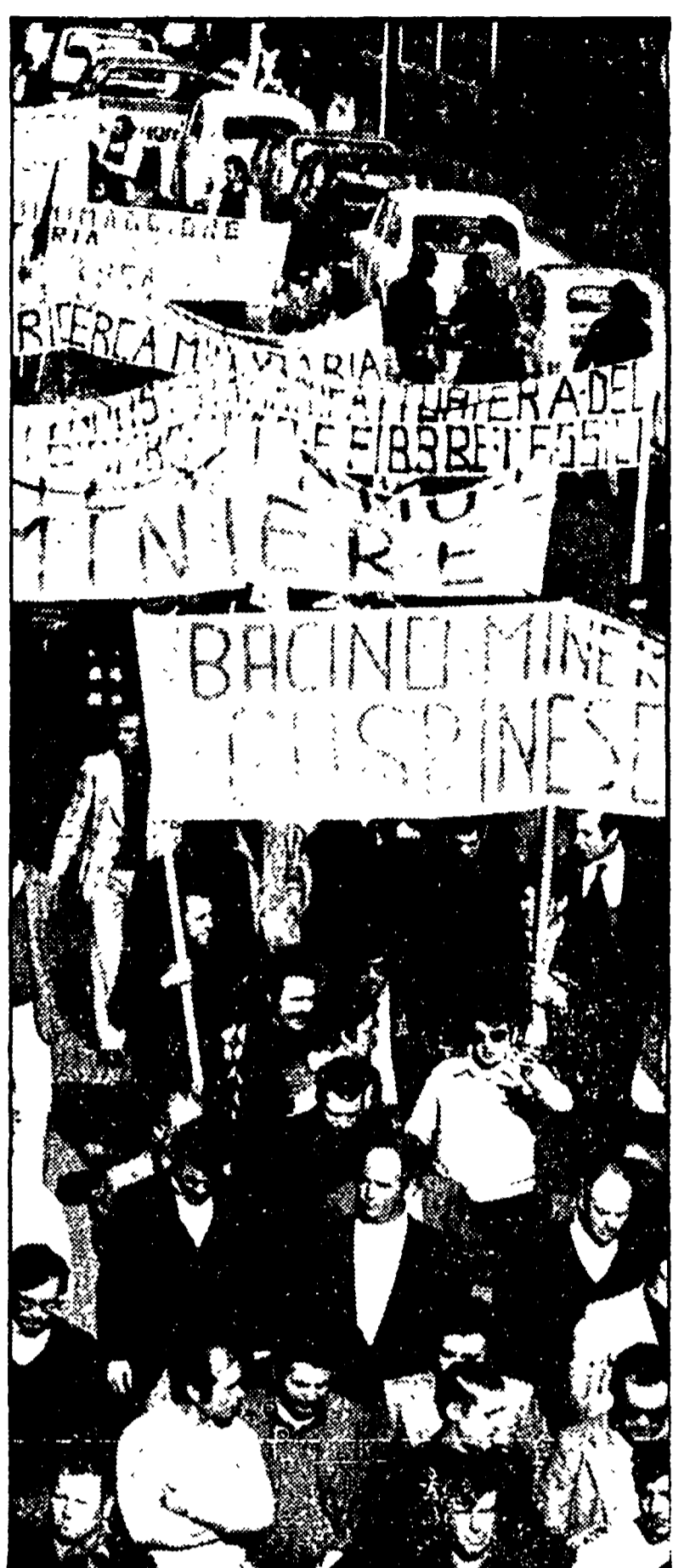
Un'immagine di un recente sciopero nel bacino minerario sardo